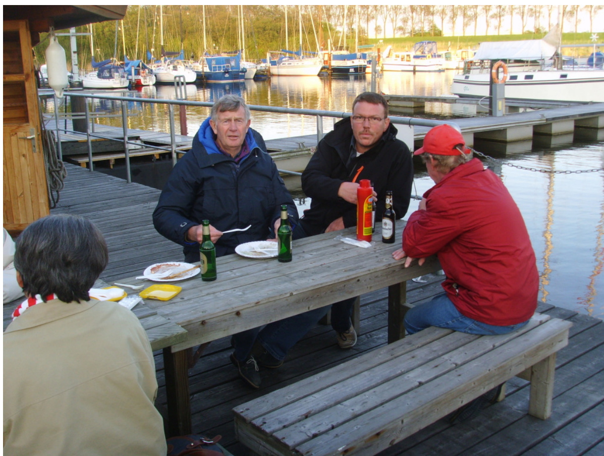
... die andere Hälfte, einige mussten schon wieder zu Hause sein