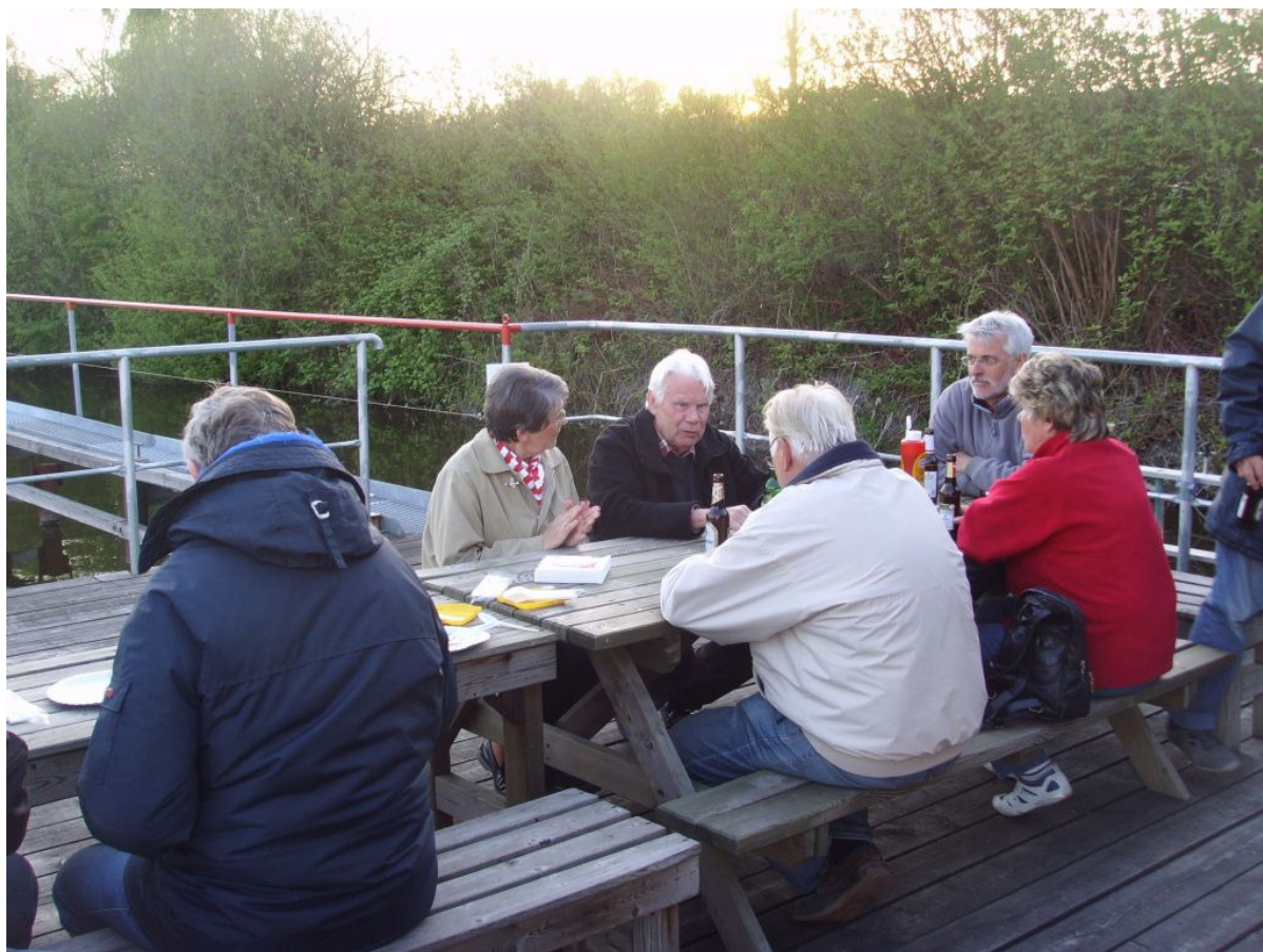
Abschluss auf dem Steg