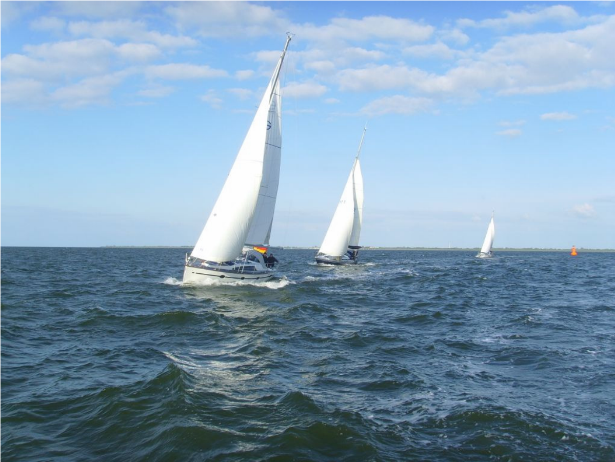
Suga, Lucky Star und Erna